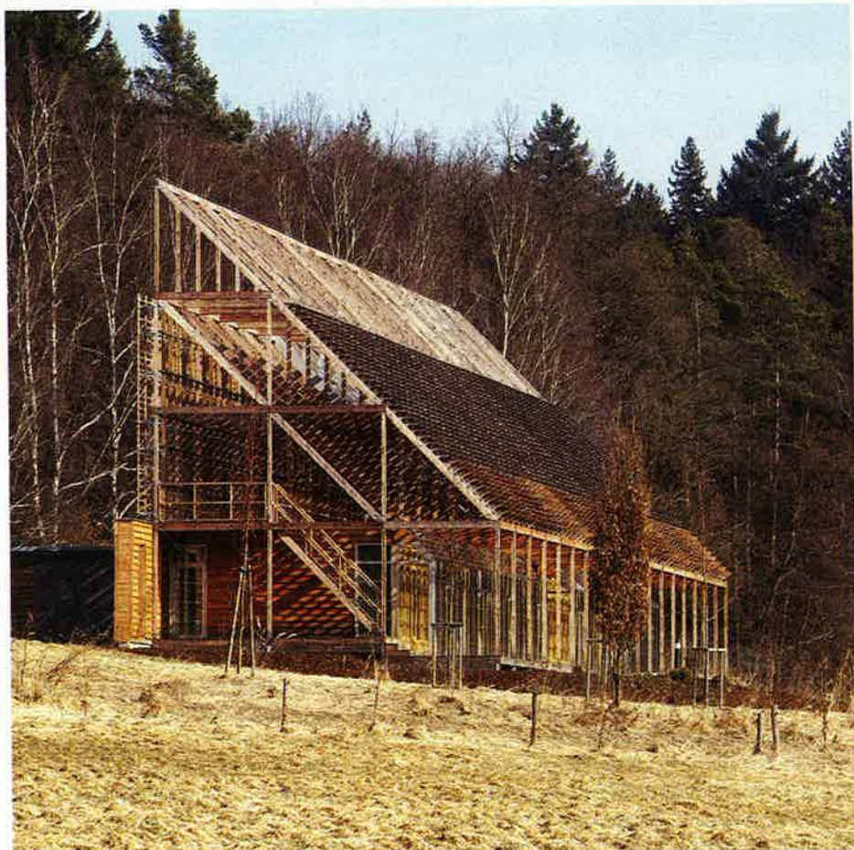
U staveb v přírodním prostředí zůstává i ve 21. století zásadní otázkou sklon střechy. Architekti se zde rozhodli pro pultovou, jejíž dřevěné lamely slouží ke stínění budovy.