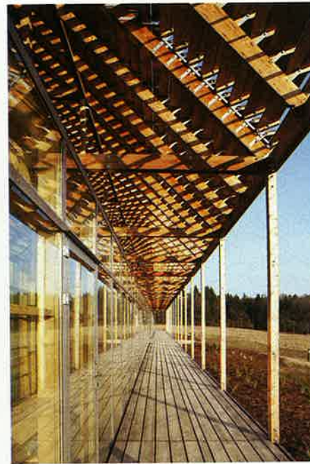
Podélná dřevěná terasa je posledním výběžkem domu, který navozuje dojem, jako by se postupně rozpouštěl v krajině.