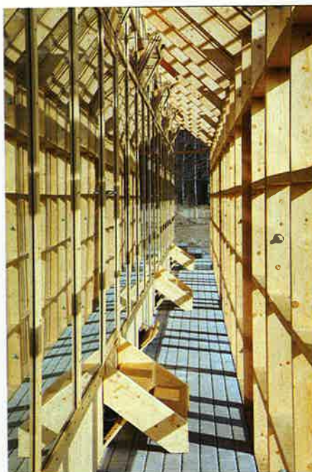
Po celé délce jižního průčelí probíhá předřazená zimní zahrada, která plní především roli pasivního slunečního kolektoru.