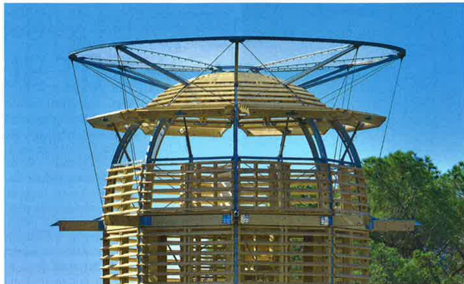
Transparentní dřevěná konstrukce se rozšiřuje nahoru, kde ji chrání „svatozář“ ze speciální membrány

Z bývalého leprosária se stala kouzelná oáza uměleckých aktivit. Naše věž je tam také kusem umění, není to jen technické zařízení. Kromě toho, že je krásná, dá se na ni vylézt a koukat do dálky. Vidíte z ní západní i východní Jeruzalém, tedy Jeruzalém židovský i palestinský. V Jeruzalémě je na každém kroku cítit magie