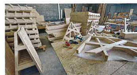
Příprava stavby ve výrobní hale