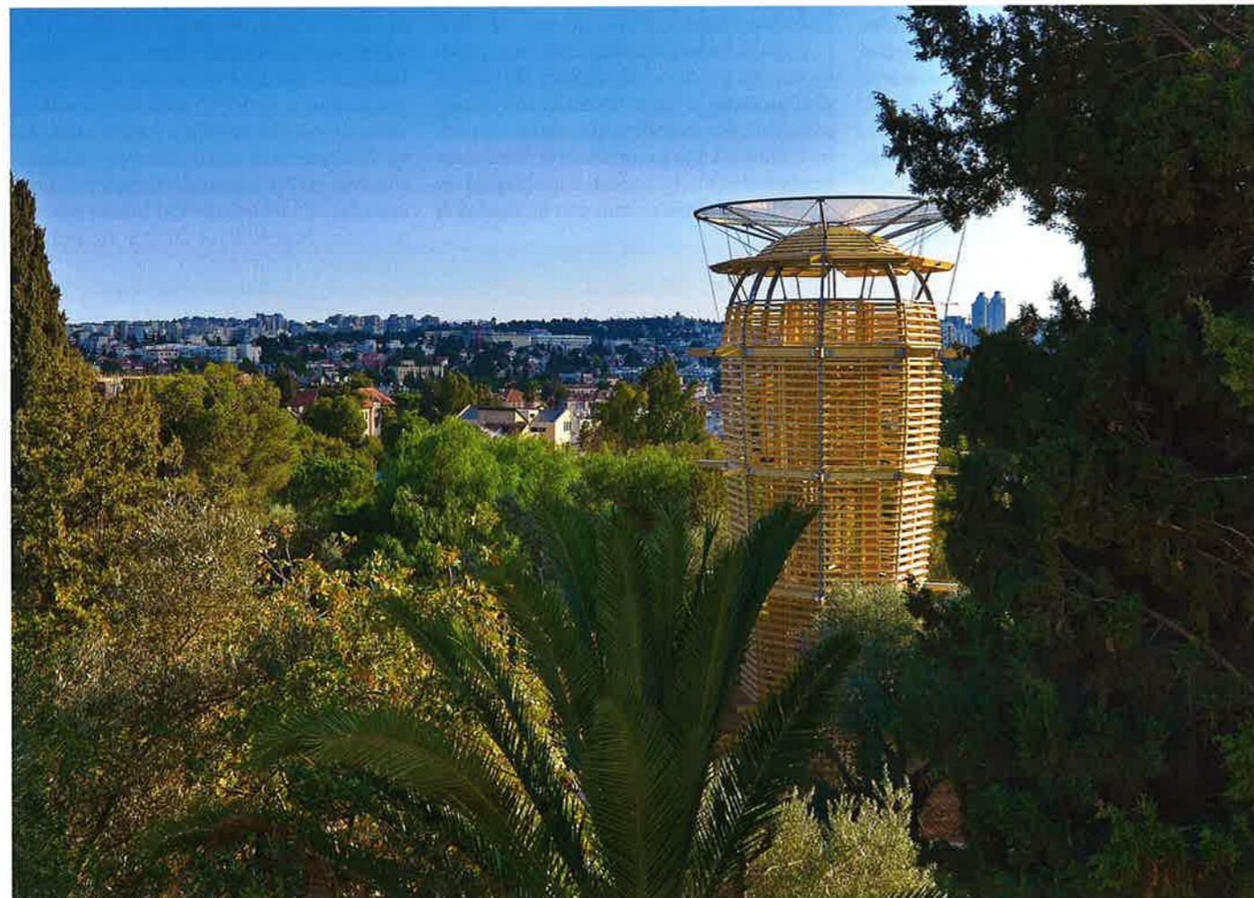
Věž stojí v Jeruzalémě nedaleko hradeb Starého města v areálu Hansen House, který byl nedávno renovován jako sídlo Centra pro mladé umění, design, technologii, architekturu a nová média

Co je sabra? No přeci kaktus! Věž má nahoře plošinku, kde se, jako květy kaktusu, oddělují jednotlivé plátky pláště a dovolují návštěvníkům skrytým ve stínu, případně chráněným před nepříznivým povětrím, kochat se nádherným okolím. Jako každé sabra, i tahle věž hodně vydrží. Sabra věž bude jediná svého druhu, protože každý náš projekt je unikátní, nikdy se neopakuje. Velmi jsme si dali záležet na tom, abychom její parametry přizpůsobili pohádkovému prostředí Hansen House a jeho zahradě – aby nepřekřikovala tohle historický stavení a byla příjemným a uznalým společníkem stovky let starým olivám a dalším stromům v zahradě, ale i domům v bezprostředním okolí areálu.“