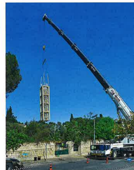
Další fáze stavby

Aby byl projekt co nejlíp realizovatelný, vyrobili jsme v Čechách jednotlivé segmenty tak, aby se vešly do dvou kontejnerů, poslali jsme je přes moře a v pro-