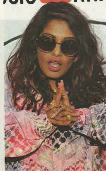
Raperka M.I.A.

lodi. V ideálním případě výtvarníky přiměje chodit za literaturou a literáty zase za uměním.