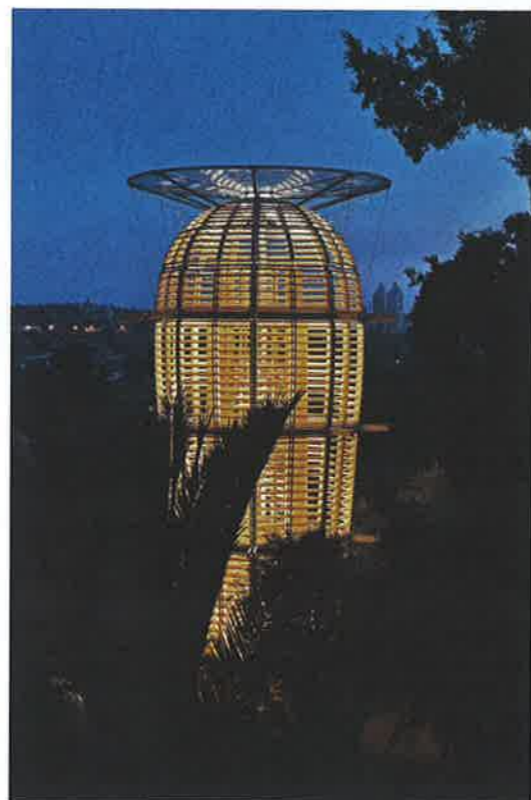
Rozhledna Ester v Jeruzalémě