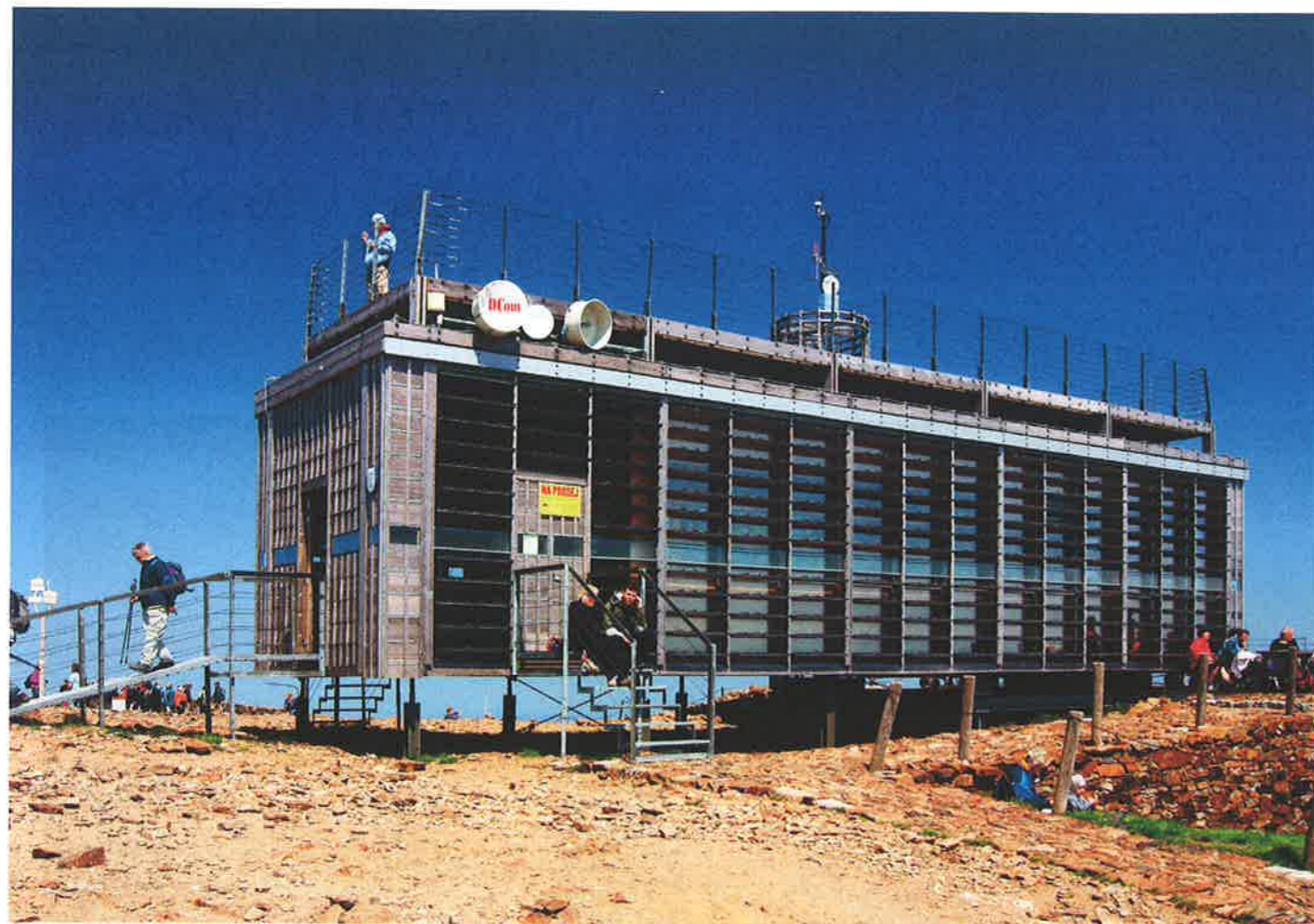
Česká poštovna "Anežka" na Sněžce