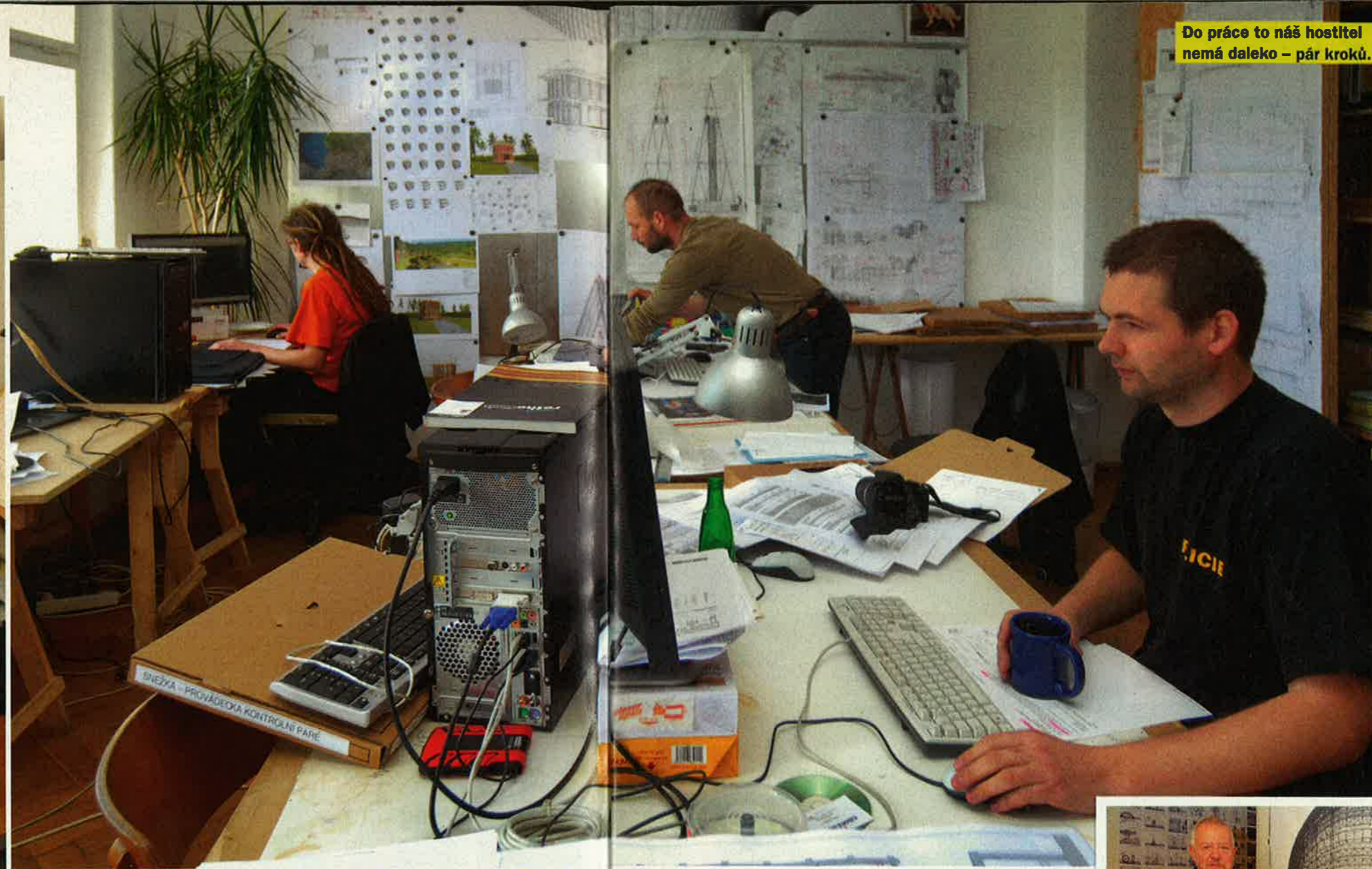
Do práce to náš hostitel nemá daleko – pár kroků.

A bude jim úplně jedno, jestli to podle stavebního zákona splňuje normy. Prostě to tam nepatří a tenhle člověk tam nemá co dělat.“