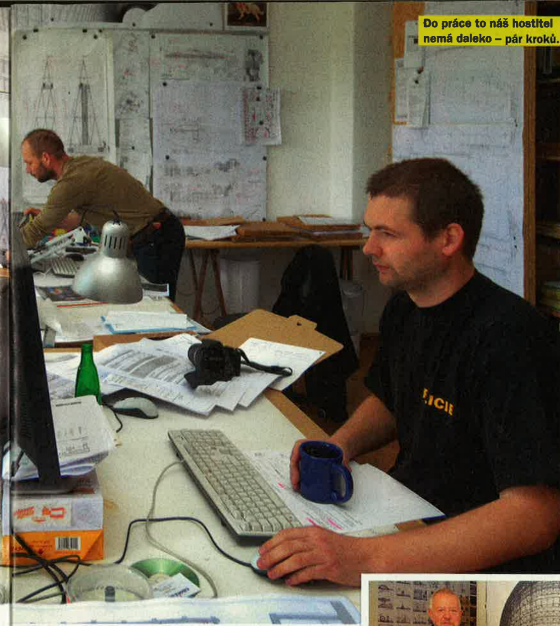
Do práce to náš hostitel nemá daleko – pár kroků.

A bude jim úplně jedno, jestli to podle stavebního zákona splňuje normy. Prostě to tam nepatří a tenhle člověk tam nemá co dělat.“