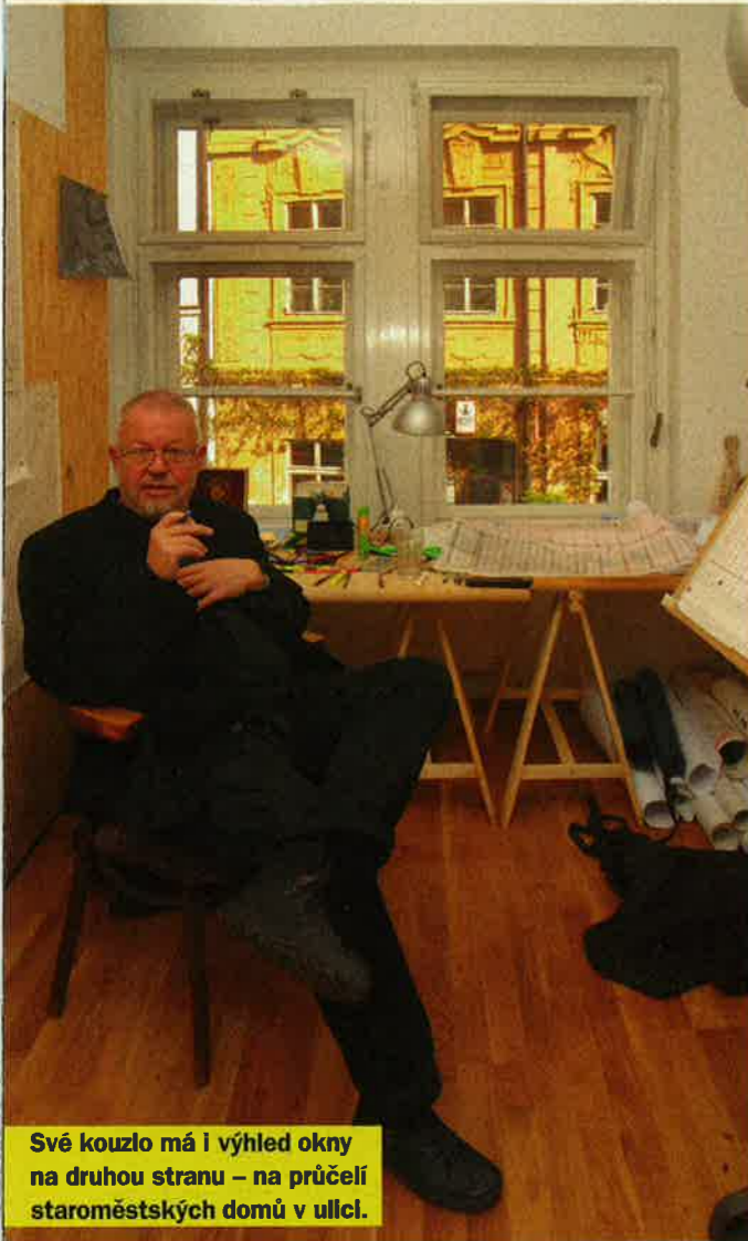
Své kouzlo má i výhled okny na druhou stranu – na průčelí staroměstských domů v ulici.