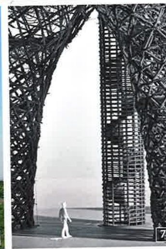
1 ROZHLEDNA BORŮVKA, 2 ROZHLEDNA U SLOUPU V ČECHÁCH, 3 AKÁTOVÁ VĚŽ V ŽIDLOHOVICÍCH, 4 ROZHLEDNA BOHDANKA, 5 ROZHLEDNA BOIKA U NASAVRK, 6, 7 MODEL DOUBRAVKY V KYJÍCH

udržitelnou architekturu od nezávislé nadace Locus, neváhejte o prázdninách vyrazit na výstavu jeho prací v Praze v Centru současného umění DOX, která trvá až do listopadu.