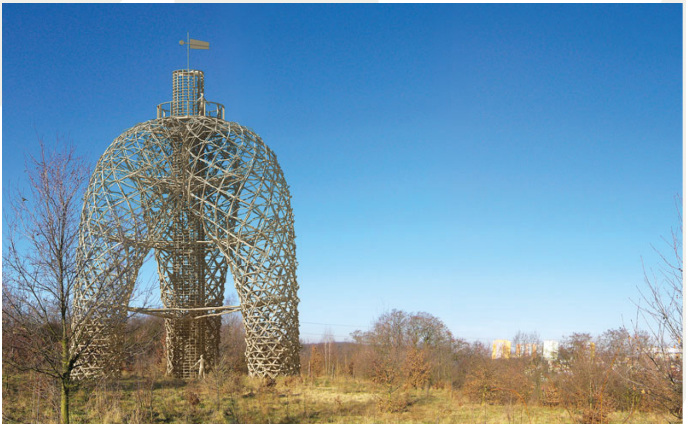
Vizualizace Huť architektury [2x]