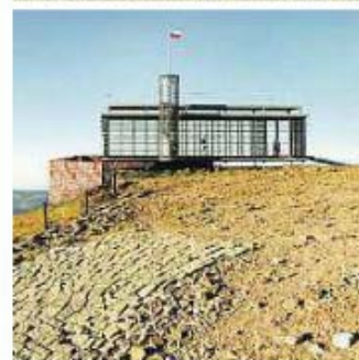
Věž Scholzberg (Horní Maxov, 2006) postavil M. Rajniš jako „sklad dřeva s kontrolním schodištěm“. Stála jen do roku 2012. Dole nová česká poštovna na Sněžce (M. Rajniš a P. Hoffman, 2007).