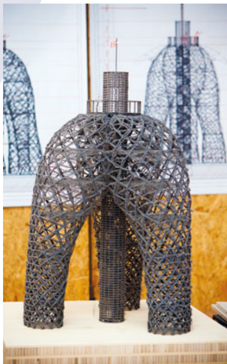
Model budoucí rozhledny pro Prahu 14.

Máme nějaké úspěchy, ale není to vždy jen pozitivní. Během posledních let jsme se nicméně hodně zaměřili na věže. V Česku, ale například i v Rakousku a Německu jsou věže nesmírně oblíbené. Jsme země výletníků, kteří mají rádi svou krajinu, chodí do přírody a rádi se po ní rozhlížejí. Rozhledna je pro lidi cílem, místem, které si určí pro svou procházku. Postavit věž přitom není kdovíjaký byznysplán, není to drahá stavba a lidi mají naprosto oprávněný pocit, že je to stavba určená jim, že se staví pro jejich radost. Znovu