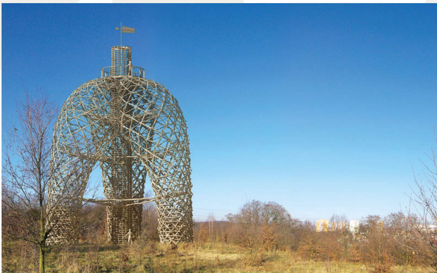
Vizualizace Huť architektury [2x]